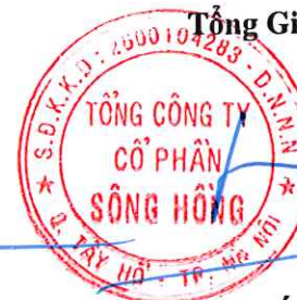
Lã Tuấn Hưng