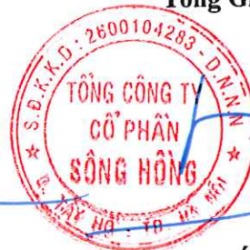
Lã Tuấn Hưng