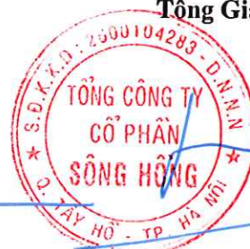
Lã Tuấn Hưng